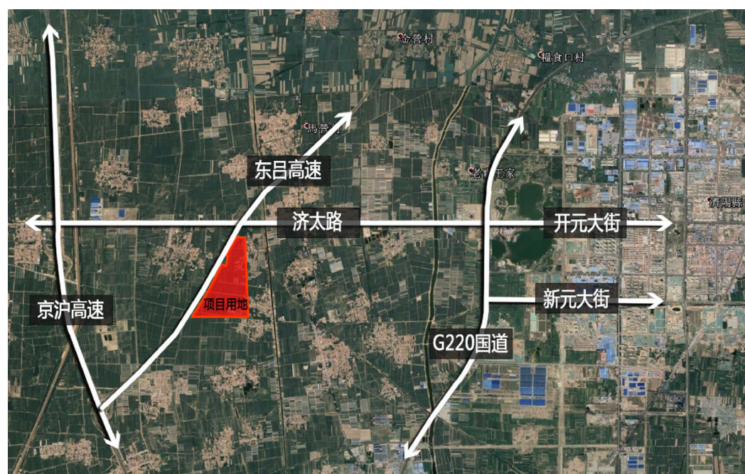
图 1-1 区域位置图

山东怡亚通供应链产业园项目位于济东高速与济太公路交汇处东南侧，园区整体规划用地 1031.6 亩。本设计为一期，位于整个项目的北端，距离京沪高速出入口 3 公里，济太路南边，东吕高速东南边，用地面积 296.695 亩。